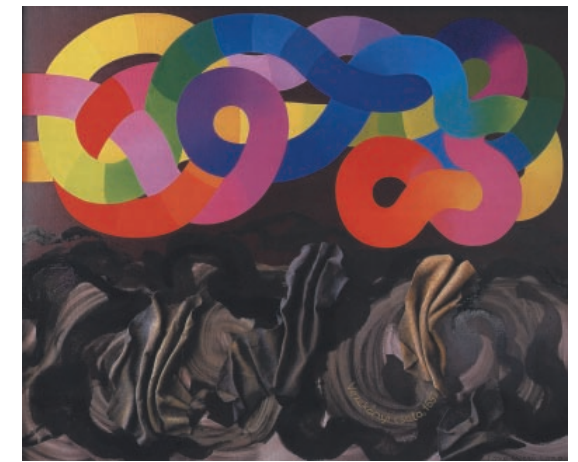
Ilona Keserű Ilona, La battaglia di Vezekény 1652 , 2003 (proprietà della pittrice)