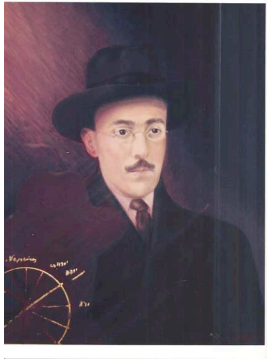
(Ennio Boccacci, Birthday horoscope , olio/tela, 40x50, 2011)

Outra vez te revejo. Viaggio nella poetica pessoana